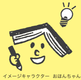
イメージキャラクター おほんちゃん

「読書感想文をどうやって書いたらいいかわからない」 「どんな本を読んだらいいかわからない」 そんな声にお答えします。 さあ、読書感想文にチャレンジしよう！